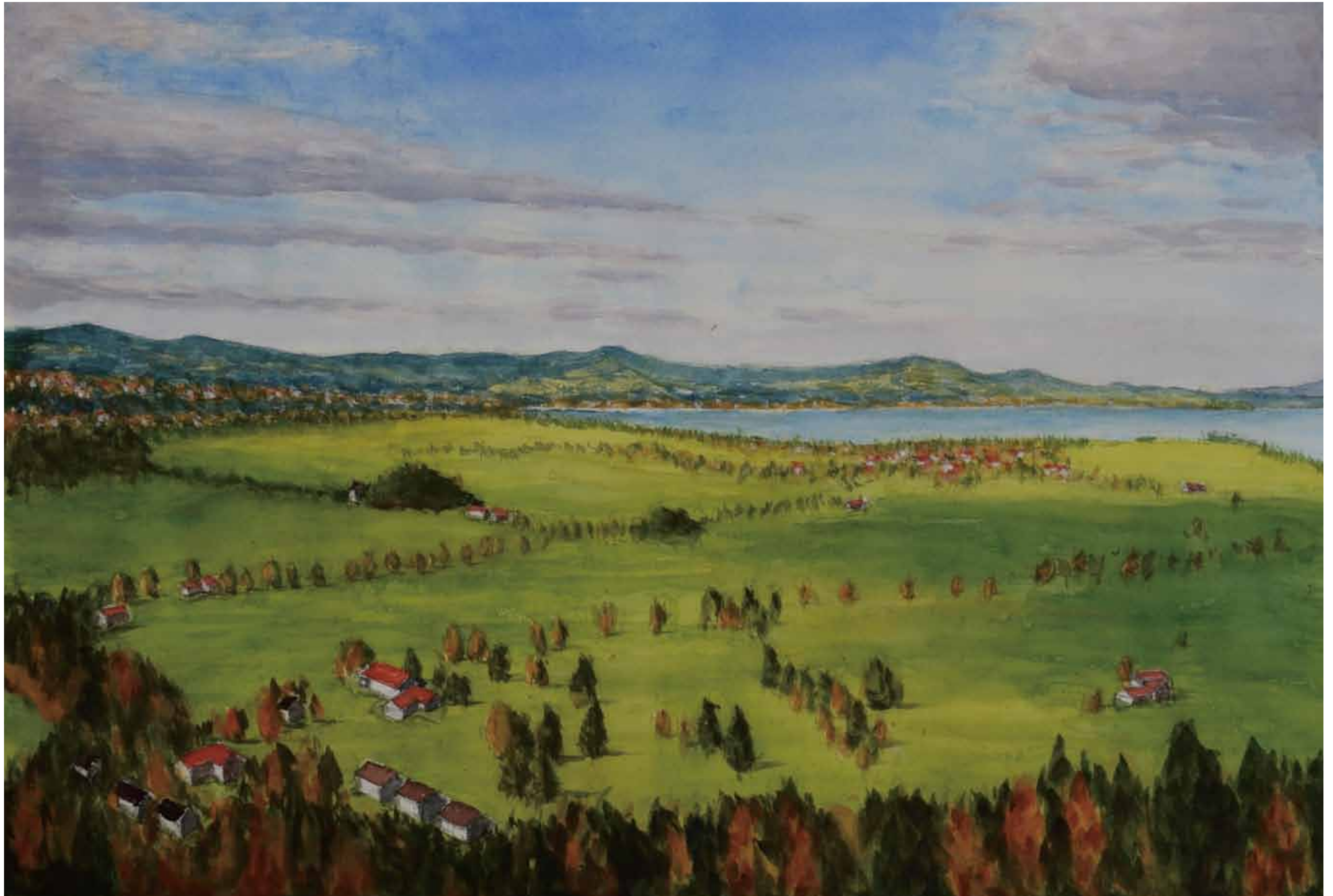
南独ババリア 点景