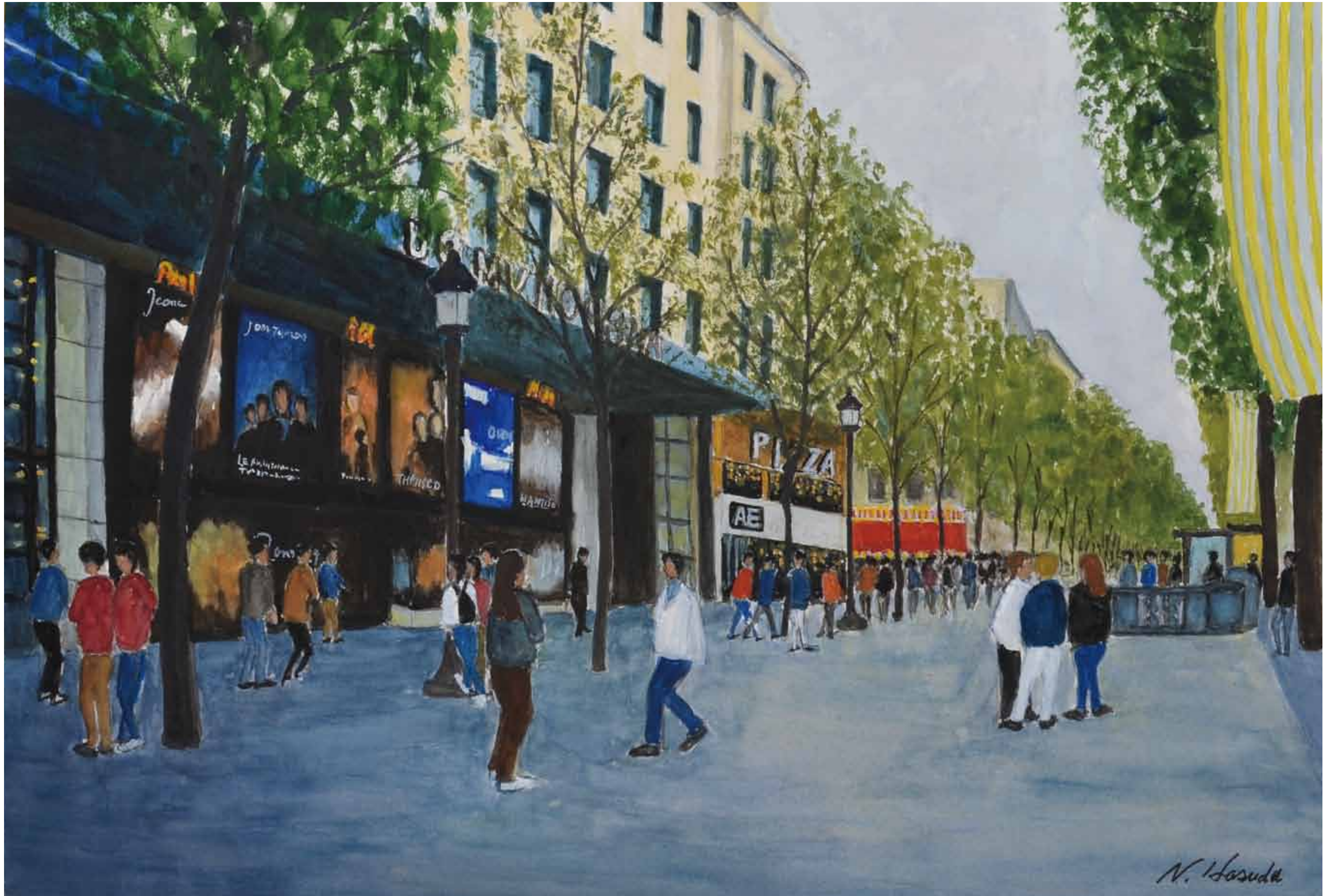
パリー シャンゼリゼー通り