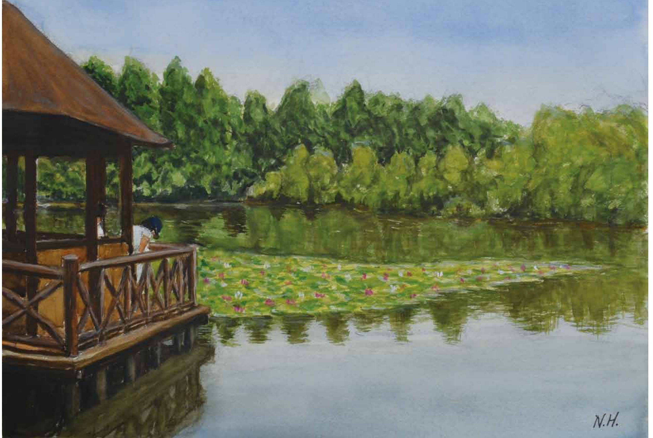
石神井公園 三宝寺池の睡蓮の花