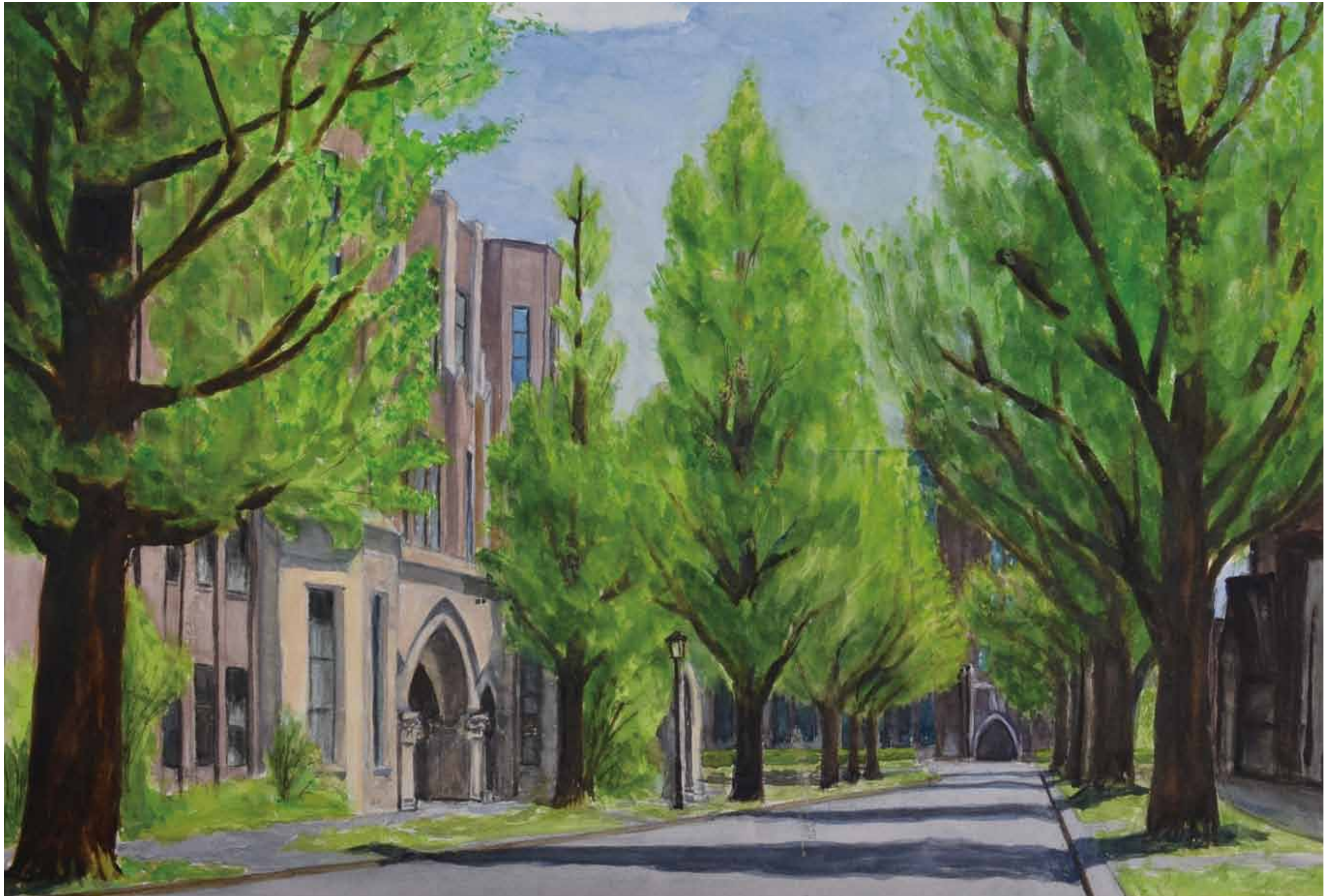
新緑の東大正門通り